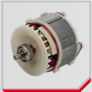
Motor sin escobillas