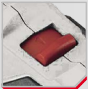
Selector de 2 velocidades

10X MAYOR VIDA ÚTIL DEL MOTOR 30% MAYOR POTENCIA 1.5X MÁS AUTONOMÍA