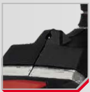
Luz de trabajo LED